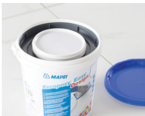
Twee-componenten voegmortel geleverd in emmers met zowel component A als component B

Na het mengen van de twee componenten zoals hierboven beschreven, brengt u de lijm aan op de ondergrond met een geschikte lijmkam. Druk de tegels/mozaïek stevig in het lijmbed om te zorgen dat de lijm goed wordt overgebracht. Als de binding is voltooid, is de hechting uiterst sterk en bestand tegen chemische stoffen.