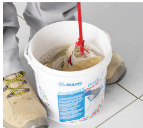
Meng de componenten (A+B)