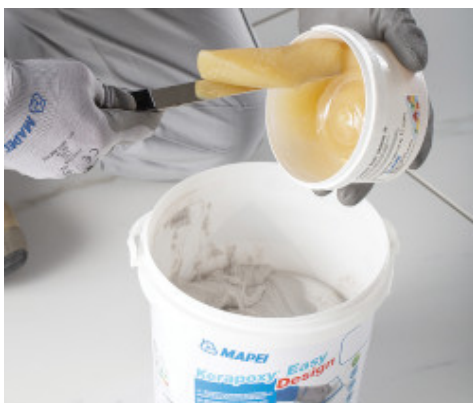
Giet de verharder (component B) in de emmer met component A