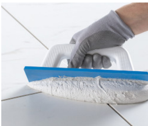
Kerapoxy Easy Design aanbrengen met een Mapei lijmkam