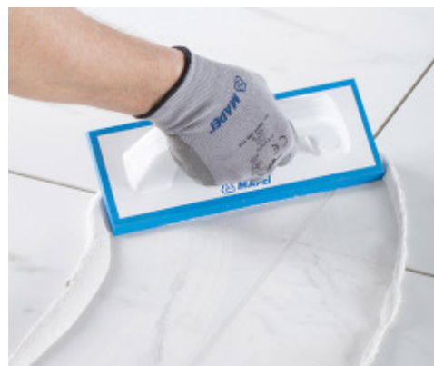
Makkelijk aan te brengen epoxy voeg