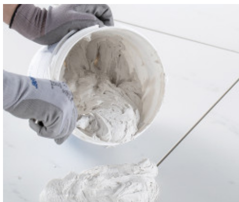
Verkrijgen van een romig homogeen mengsel